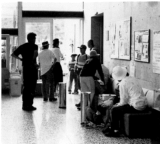
エントランスはコミュニケーションの場

しかし、こうした全国的、地域的減少傾向を尻目に、「甲斐黄金村・湯之奥金山博物館」は、平成13年度に入り4、5、6、7、8月の5箇月間とも、前年同期の入館者数を上回る来館者を迎えています。「博物館」に人が帰ってきた、そんな感じもするわけですが、他館の関係者に聞くとそうでもない、そんな状況ではありませんよ、という答えが返ってきます。開館4年5箇月で近く8万人を迎えます。