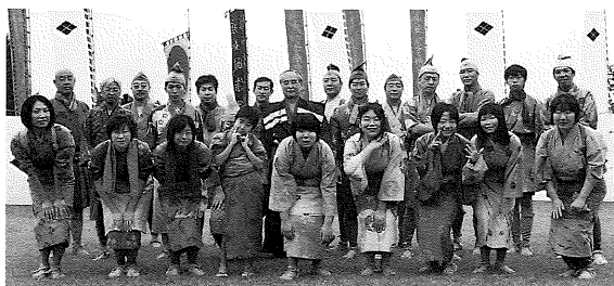
戦国時代にタイムスリップ

早い時間の集合だったにもかかわらず、出演した皆さんは「いい思い出になりました」と満足してくれたようです。