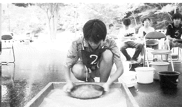
優勝の灘中・高チーム