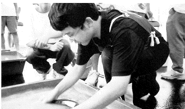
準優勝の駿台甲府中・高チーム