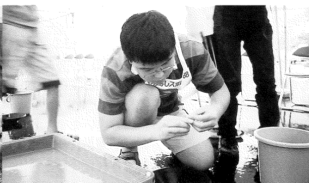
敢闘賞の開成中・高チーム