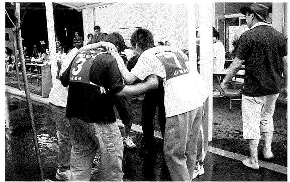
円陣を組んで気合いを入れる駿台甲府チーム