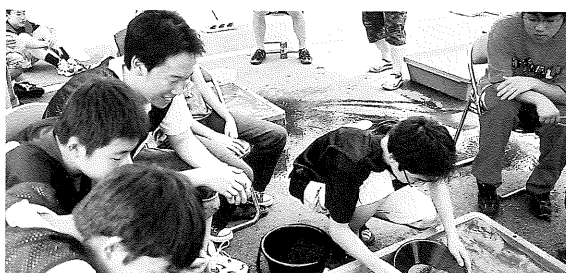
山梨学院大附属中高

どんなに時間が少なくとも、手元のバケツの砂を残すことはタイムアップを意味します。団体戦トリの選手たちは一番苦しい立場ですが、残りわずかな時間とプレッシャーの中で、5校とも何とか30分以内にパンニングを終えることが出来ました。団体戦は、東京開成、駿台甲府、灘、海城学園、山梨学院大付属という順位結果でしたが、団体戦での得点と、個人戦での得点が加算され、総合順位となります。その結果、