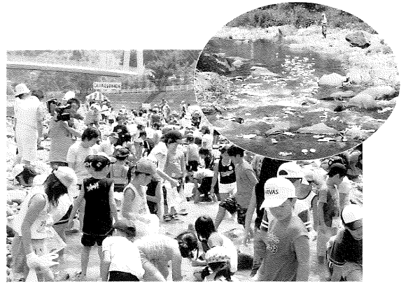
下部川を流れる“やまめちゃん”と賑わう会場

リーした人たちの応援にも、熱が入っている様子でした。見事レースを勝ち抜いた1着のやまめちゃんは、去年のやまめちゃんと並んで博物館エントランスに展示されています。