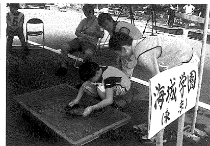
初出場・海城学園中高