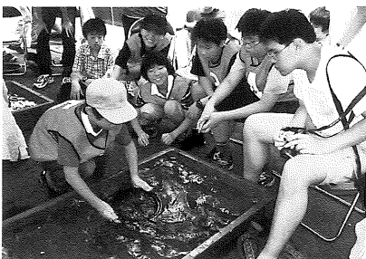
第3回大会制覇・東京開成中高

続いて、制限時間30分以内に5個のバケツ（1つのバケツにつき5kgの砂）を5人ですべてパンニングし、中に混入されている合計20粒の砂金を見つけ出す団体戦が行われました。リレー方式のこの団体戦では、選手それぞれが自分の持ち時間を考えてパンニングしなければなりませんから、連帯作業の難しさも加わります。開始の合図とともに一斉スタートしましたが、2人目の選手にリレーされる辺りから、各校間に徐々に差がつき始めてきました。この少しの差がじわじわと後に続く選手にしわ寄せされますが、タイムアップしてしまうと団体戦の得点