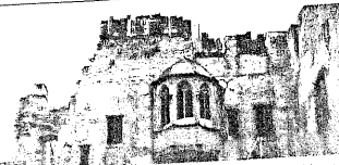
War loomed. The castle grew. Light-ning struck. The upper part of the castle went to hell.

Home erected Heidelbergians checked out locations in the Heidelberg area and found the numerous law firms