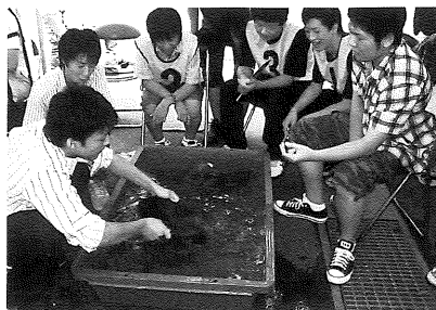
昨年の優勝校・駿台甲府中高