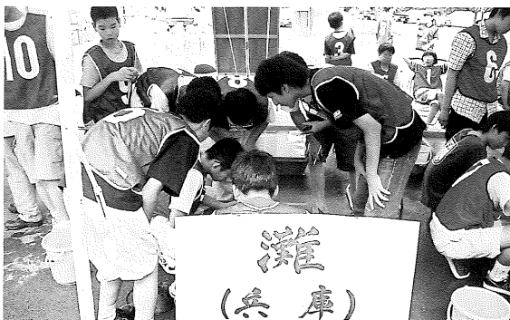
ベテラン校・灘中高

さて、後日談ですが、今年、開成学園の選手たちと先生は、中山金山遺跡への登山を大会翌日に決行いたしました。大会の疲れも若さと気力で吹き飛ばすのか、朝早くの集合にも関わらず、元気良く出発し、全員が現地に着し、無事に下山しました。苦勞して辿り着いた現地での遺跡や坑道の見学など、生き生きとした表情で、砂金掘り大会とは違う楽しみを味わったようです。