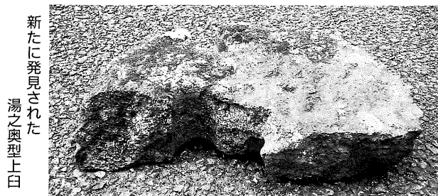
新たに発見された 湯之奥型上臼

茅小屋金山は平成元年の総合学術調査内における関連調査以来、詳細調査は行われていませんが、その後の茅小屋現場確認の際に、発見されている鉱山道具は、磨り臼と上臼があります。(『館だより14号』で紹介)。特筆すべきは、発見されている上臼の全てが「湯之奥型」であることです。全国的に鉱山研究が進み、様々な形態の鉱山臼が発見される中、鉱山臼のさらなる詳細な体系化を進める必要に迫られており、こうした新たな発見が重要な一資料になります。なお、開館以来の懸案事項として、中山金山のさらなる調査、内山・茅小屋2金山の詳細調査が強く望まれています。