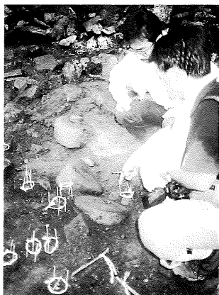
平成元年・中山金山調査

以上の諸学が、一つのテーマを設定して取り組む「学際的研究」については、既に「館だより」でお伝えしてきましたが、その総合学術調査が日本において、偶然にも山梨県における特徴的な2金山遺跡で継続的に行われ、その成果がいま、日本の金銀鉱山遺跡調査の先駆的役割を担いつつあります。