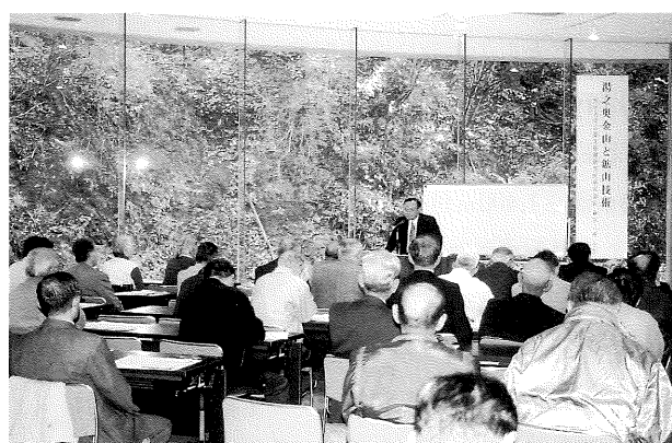
昨年の第3回 公開講座