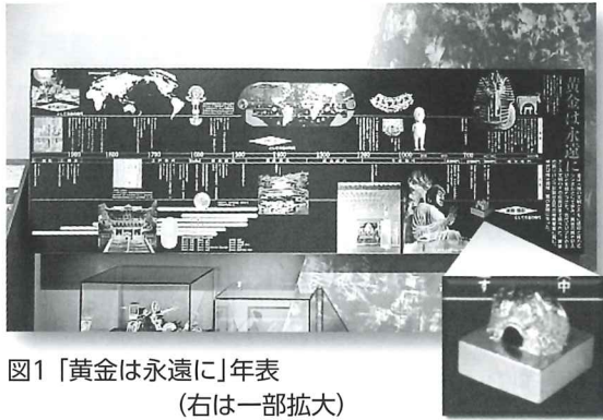
図1 「黄金は永遠に」年表 (右は一部拡大)