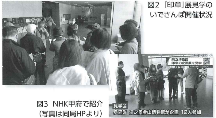
図2 「印章」展見学の いでさんぽ開催状況