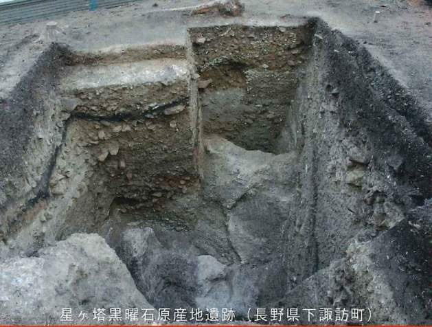
星ヶ塔黒曜石原産地遺跡（長野県下諏訪町）