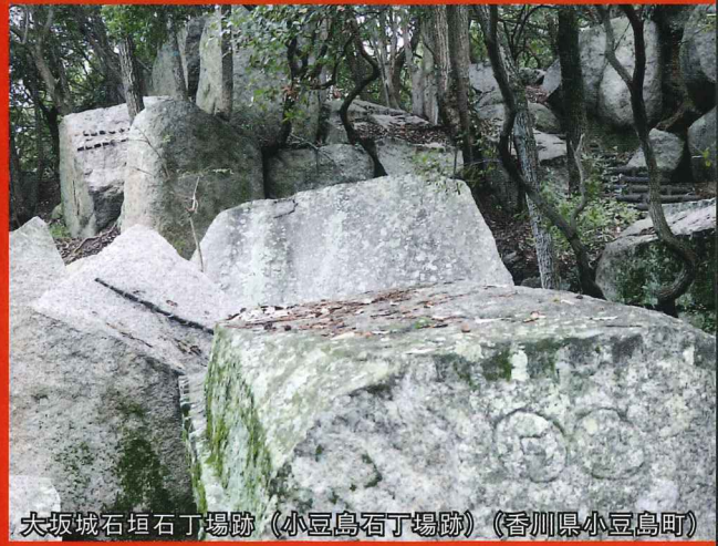
大坂城石垣石丁場跡（小豆島石丁場跡）（香川県小豆島町）