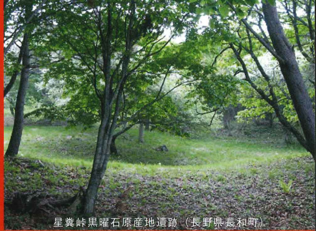
星ヶ塔黒曜石原産地遺跡（長野県長和町）