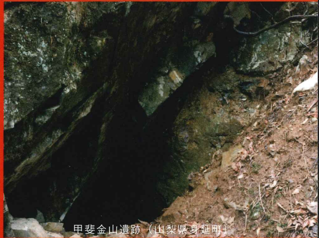
甲斐金山遺跡（山梨県身延町）