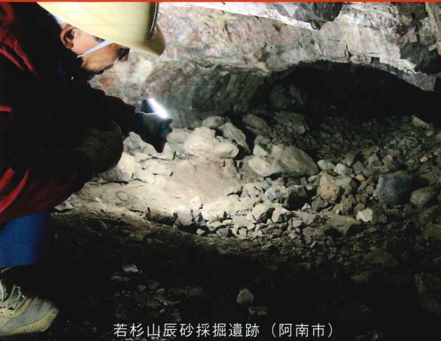
若杉山辰砂採掘遺跡（阿南市）