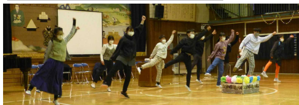
6年生からはダンスのプレゼント！ ← 『ジャンボリミッキー』 6年生のエンタメ力は天下一品です