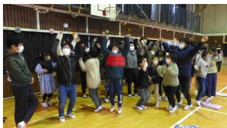
6年生クイズ「やった～正解！」

3月3日、『6年生を送る会』が行われました。5年生を中心に、お世話になった6年生に感謝の気持ちを伝えようと計画されたもので、全校児童で準備や練習をしてきました。6年生に関するクイズや、全校かくれんぼ、6年間の思い出のスライド、在校生からの歌と色紙のプレゼント等、笑顔と感謝の気持ちにあふれた楽しい楽しいひとときでした。また、立派に会を運営してくれた新児童会本部を中心とした5年生や、ステキな色紙を中心になって作ってくれた4年生の活躍もとても頼もしく、来年度の身延清稜小学校も今から楽しみです。