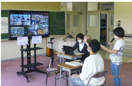
～児童会本部～ 提案し議長が話し合いを進めます。