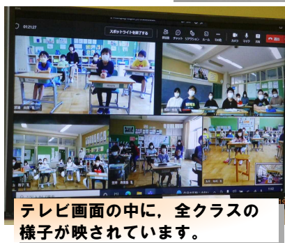
テレビ画面の中に、全クラスの様子が映されています。