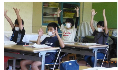
手話で『賛成』という意思を表しています。