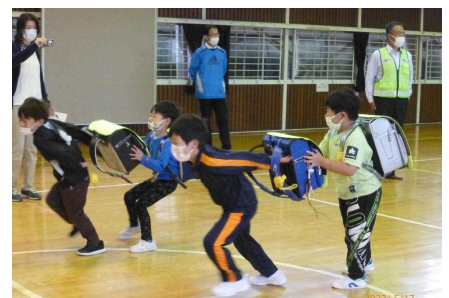
もしもランドセルをつかまれたら…