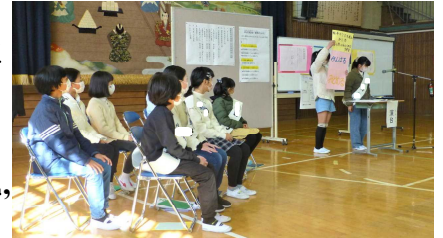
～立候補者・責任者～ みんな気迫のこもった演説でした。

2月1日、来年度の身延清稜小の児童会役員を決める選挙の立ち会い演説会が行われました。体育館に入ってくる子どもたちの表情はとても真剣で、ぴんと張り詰めた空気の中、会は始まりました。立候補者と責任者による意気込みの感じられる力強い演説、その演説を、背筋を伸ばし、じっと聞く子どもたち……。全校のみんなが身延清稜小の児童会をつくっていくのだという姿勢が感じられ、とても頼もしく思いました。