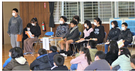
選挙管理委員の進行やあいさつも きびきびしていて、とても立派でした。