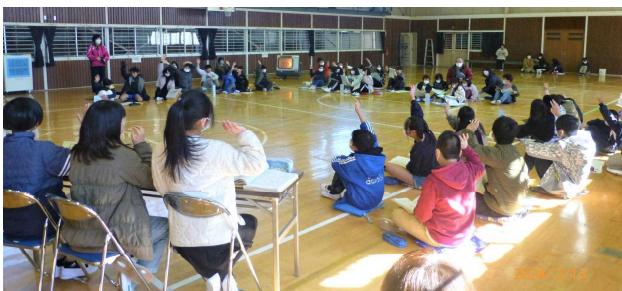
手を挙げて 自分の意志を 表しています。