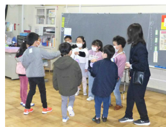
みんなでジャンケンポン!

2月21日(水), 令和6年度の新1年生と保護者の皆様をお迎えし, 『1日入学・保護者説明会』が行われました。1年生は「新しい1年生に楽しんでもらおう。」とゲーム等の準備をしながらこの日を待っていました。学校での弟や妹ができることをとって楽しみにしているようです。新1年生の入学を, 職員, 児童, みんなで待っています。