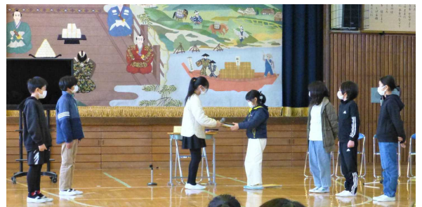
新しい児童会本部への引き継ぎ式