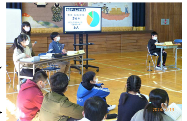
～児童会本部の提案～ 全校児童の振り返りをグラフにして、分かりやすく提示してくれました。

2月13日（火）、今年度の児童会活動の総まとめとなる児童総会が行われました。各学年では、事前に本部から配られた『スローガン 笑顔で協力 明るく楽しい身延清稜小』や『活動の柱』についてのまとめの資料をもとに、自分たちの1年間を振り返り、それぞれ話し合いを行い児童総会に臨みました。当日は、各学年からの反省や意見が活発に出されました。お互いに聴き合う態度もすばらしく、話す人をじっと見つめ『耳でも目でも心でも』聴こうとしている子どもたちの姿に感心しました。全校みんなが今年度の活動をしっかりと振り返ることができました。その後、今年度の本部役員から新役員への引き継ぎ式が行われ、児童会の『バトン』が渡されました。1年間、下級生をリードしてくれた児童会本部役員、6年生の皆さん、本当にお疲れ様でした。ありがとう！