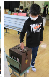
大切な一票です。 真剣に投票しています。