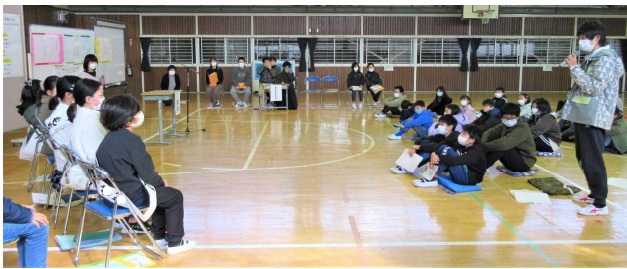
演説の後、質問が出され、一生懸命答えていました。

演説会の後、一人一人が真剣に投票を行い、令和6年度の新役員が決定しました。来年度の身延清稜小児童会のリーダーとしての活躍を、楽しみにしています。