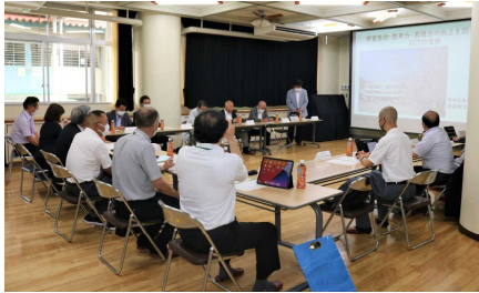
ICTの活用について 概要の説明

今回、このような機会をいただけましたことに心より感謝し、今後も一人ひとりの児童にとって深い学びへとつながるような授業づくりの研究を重ねてまいりたいと思います。