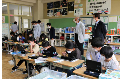
3年算数「きよりと道のり」