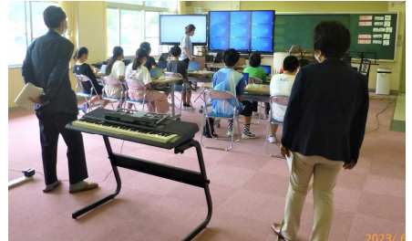
6年音楽「和音の音で旋律づくり」