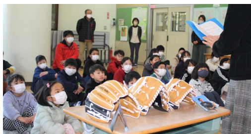
じつとメッセージを聴く子どもたち ～瞳がキラキラ輝いていました☆～

全校集会で子どもたちにこのメッセージを紹介し、贈呈式を行いました。テレビ等の報道でも話題になっているので、みんな興味津々で、グローブを手にとっていました。休み時間には、毎日誰かが借りにきて、みんなで楽しそうにキャッチボールをしています。子どもの頃から夢に向かって努力を重ねてきた大谷選手！身延清稜小の子どもたちにも『夢をもち、夢に向かって努力できる人』になってほしいと願っています。