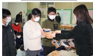
代表の6年生にグローブを贈呈