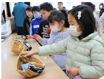
最後に、それぞれ、さわったり、 手にはめてみたりしました。