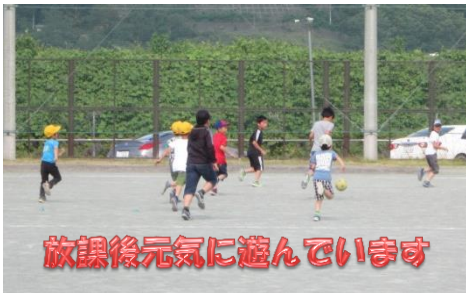
放課後元気に遊んでいます

全校一斉の集団下校前の放課後には、校庭で元気に遊ぶ姿がよく見られます。上級生がリードして下級生と共に異年齢集団で遊ぶことは、とても大切なことだと感じています。