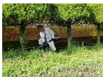
刈払機で校庭の草刈り