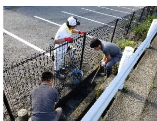
校地西側溝の泥上げ