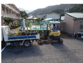
重機で草置き場片付け