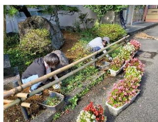
校舎周り花壇の草取り