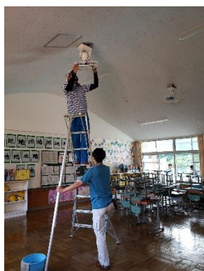
天井付けの扇風機清掃

夏休み終わり間近の8月24日(土), 早朝からたくさんの保護者の方にお集まりいただき, PTA 環境整備作業を実施しました。普段, 子どもたちと職員だけでは, できない場所やどうしても大人の手数が必要となる場所をきれいにしていただきました。子どもたちの教育環境整備のために, お力を貸していただき本当にありがたく思いました。5・6年生も参加しましたが, 汗を流しながら働く大人の姿を見ることは, 子どもたちにとって, かけがえのない学びになったのではないかと思います。ご協力ありがとうございました。