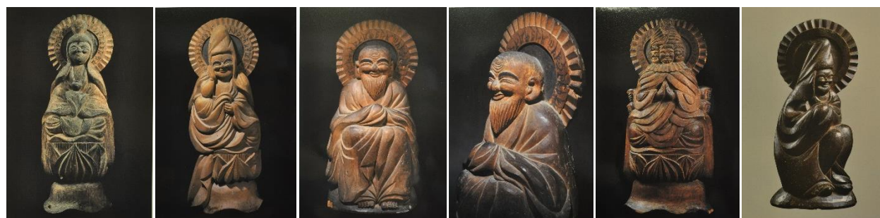
①薬師如来 ②如意輪観音菩薩 ③自身像 (正面) ④自身像 (右横) ⑤三面馬頭観音菩薩 ⑥白衣観音菩薩