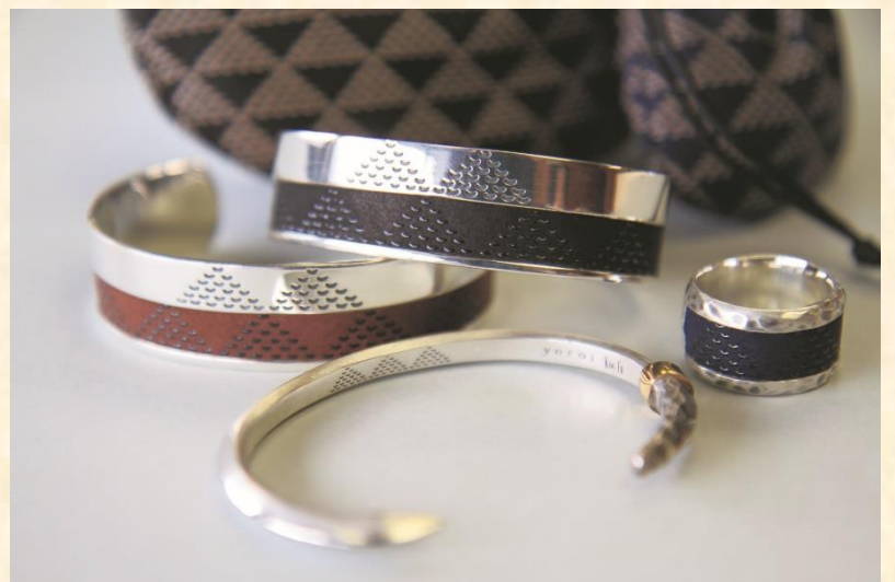
カガヤカ アクセサリー「yoroi」デザイン(2014)