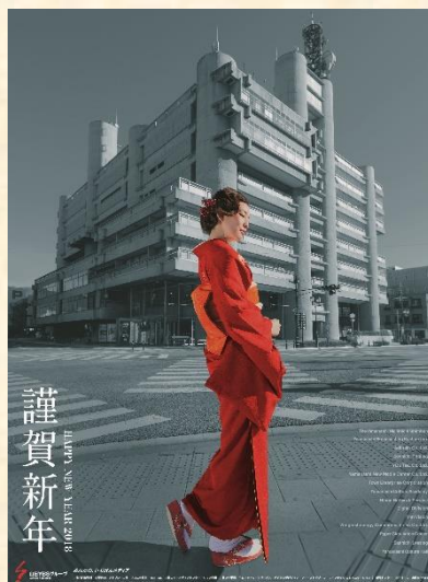
山日YBSグループ 年賀新聞広告(2018)