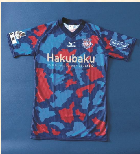
ヴァンフォーレ甲府50周年 夏季限定ユニフォームデザイン(2015)