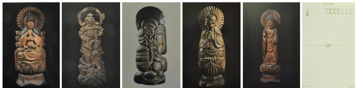
⑦准胝観音菩薩 ⑧毘沙門天 ⑨大黒天 ⑩地藏菩薩 ⑪阿弥陀如来 裏面