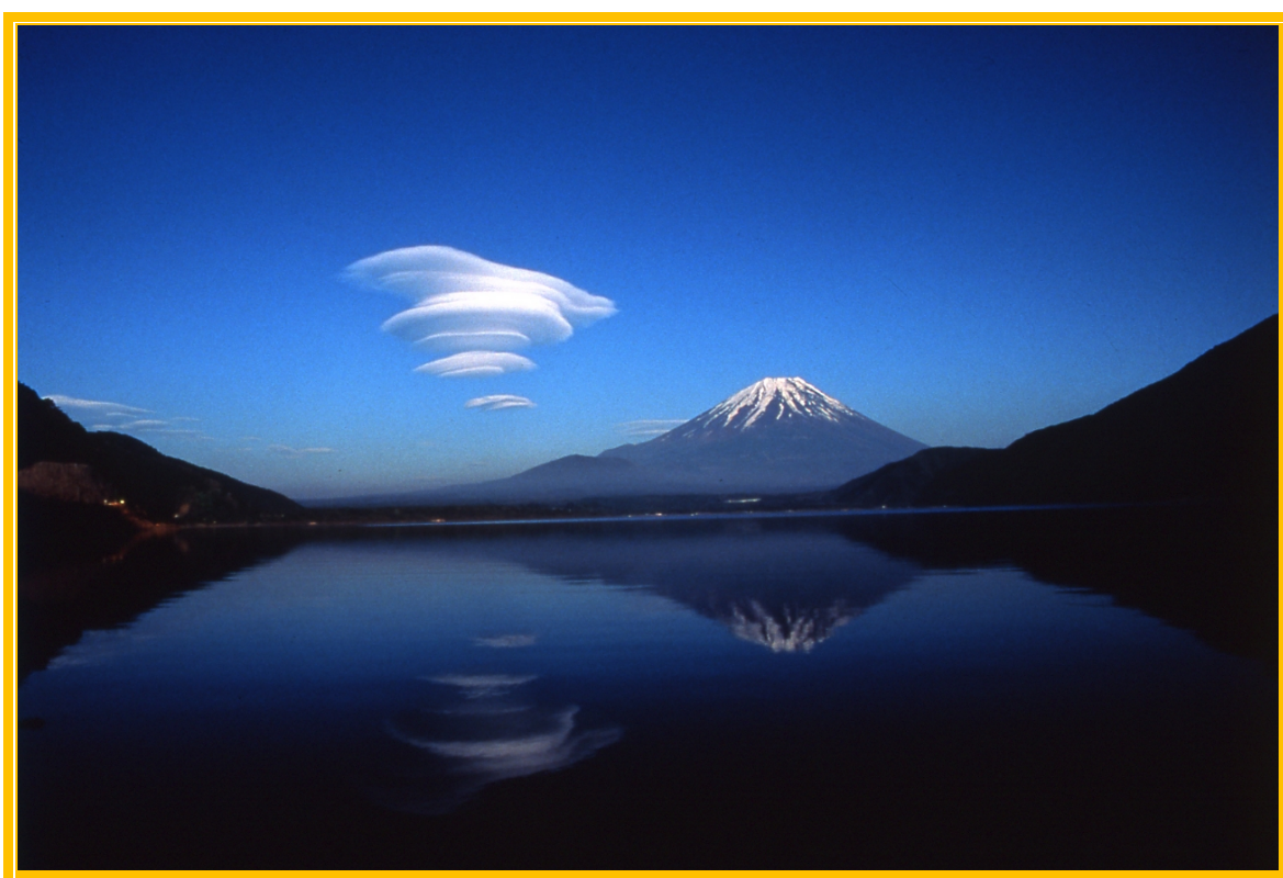
本栖湖からの富士山（千円札の裏面撮影地）