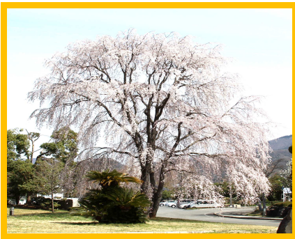
町の木 シダレザクラ