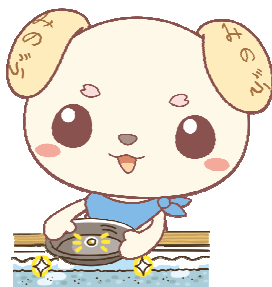
砂金採り体験「金山博物館」