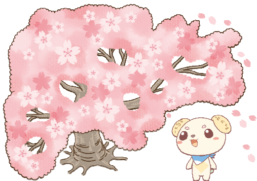
身延山久遠寺やクラフトパークの桜