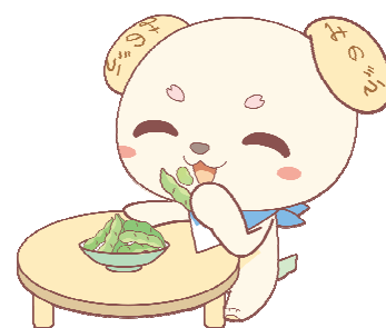
特産「あけぼの大豆」