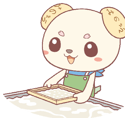
和紙漉き体験「西嶋和紙の里」