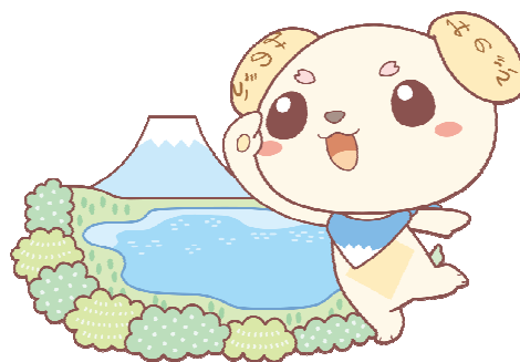
千円札の裏面撮影地「本栖湖」