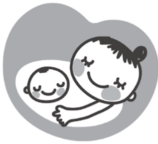
マタニティマーク

マタニティマークを通した「妊婦さんや赤ちゃんに優しい環境づくり」にご理解ください。