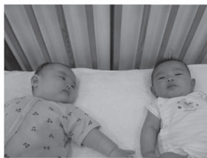
身延児童館「ニューフェイス」