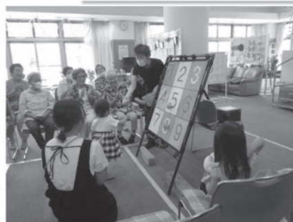
身延児童館「生きがい広場訪問」