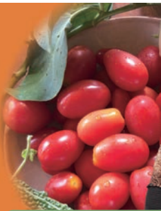
サチコさんのヴェス