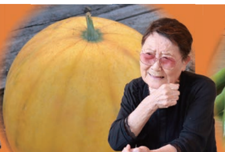
クニエさんのスイカ