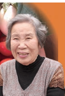
ヴィアーノトモト