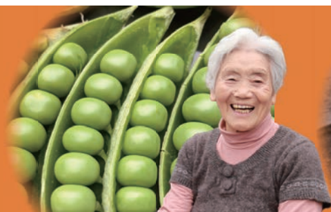
ヒデコさんのツルなしエンドウ