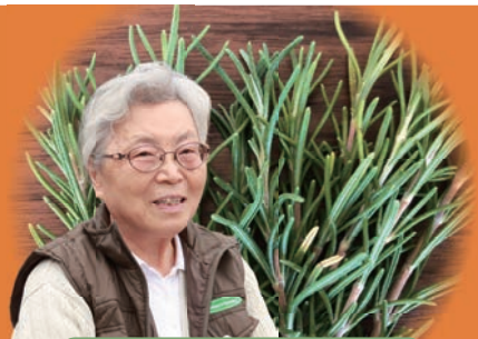
カスミさんのローズマリー