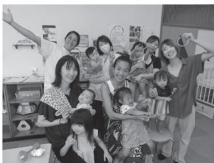
ぬくぬくひろば「マクラメ」

▼ぬくぬく出張ひろばでは、紙コップとビニール手袋を使って「とべとべにわとり」を作りました。ストローから息を吹き込むと、ニワトリがぴよこんと飛び出して、大人も子どもも大喜び！ぜひ気軽に遊びに来てくださいね。