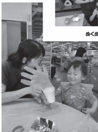
ぬくぬくひろば「とべとべにわとり」