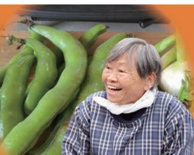
マスエさんのフアーベ