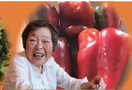
ケイコさんのスイートペッパー