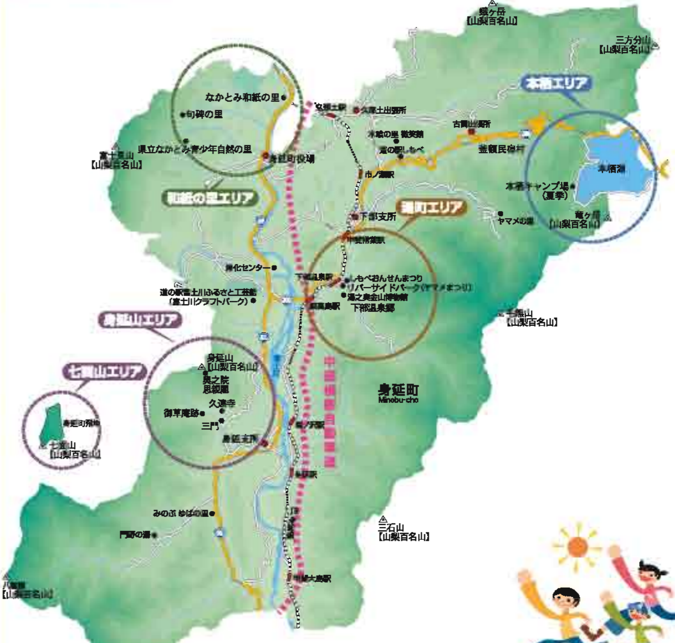
身延町には、地域資源がたくさんあります。「みのぶのびのびガイドブック」を参考にして下さい。