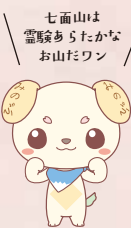
七面山は 霊験あらたかな お山だワン

「七面山は南アルプス連邦に属する標高1982mの豊かな自然が残る美しい山であり、古来は山岳信仰の対象として、日蓮聖人が身延山にご入山されて以降は法華経信仰の聖地としてお参りされてきた霊山です。現在、山頂近くにある敬慎院には、身延山を守護する鎮守神として七面大明神がまつられており、秋の例大祭をはじめ多くの方が参拝に訪れます。また、春と秋のお彼岸には、富士山頂からの美しいご来光を拝することが出来ます。登詣には、山坂が続く参道を4〜5時間お登りいただくことになりますので、お気をつけてお越しください。」