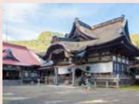
七面山敬慎院 ☎ 0556-45-2551 ⑧ 身延町身延 4217-1 ⑨ https://www.kuonji.jp/shichimenzan