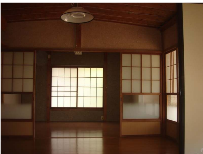
和室より洋間・リビングを見る