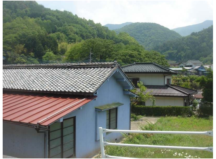
北側より見る、庭（菜園）が隣接