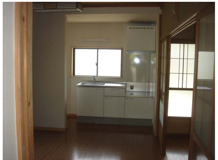
リビング・キッチンを見る