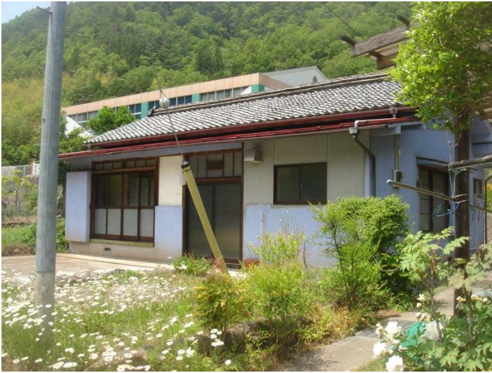
南側より敷地・建物全景