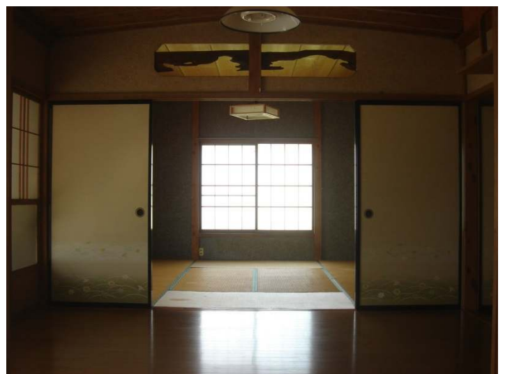
リビングより和室を見る