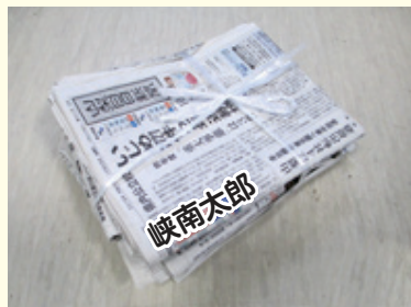
新聞 十文字に束ねる