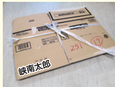
ダンボール 十文字に束ねる(50cm 四方)