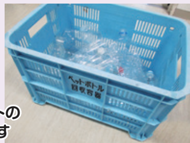
コンテナに名前を 記入してください