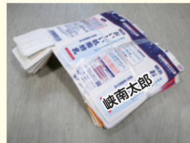
紙バック 水洗いして切り開き、 十文字に束ねる ※中が白いものに限る