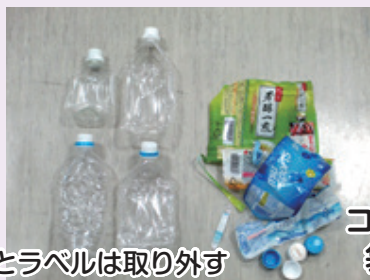
コンテナ・ネットの 袋に入れて出す