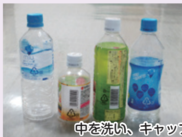
中を洗い、キャップとラベルは取り外す