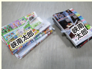
雑誌・広告 十文字に束ねる