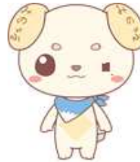
極端な顔の部品の変更