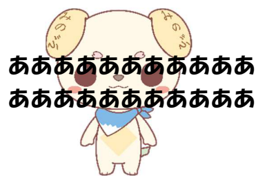
文字を重ねて使用