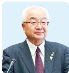
身延町長 もちつき みきや 望月 幹也

町民目線に立ち、住民の福祉の増進に努めるとともに、最少の経費で最大の効果を挙げるよう、スピード感をもって、職員一丸となって予算執行に当たる