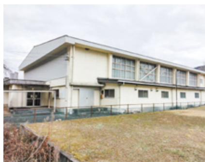
解体予定の大河内体育館

問 補助金負担金等の適正な運用について、交付先団体に対する事業評価は、だれが・どのような資料内容で実施しているのか、財務報告は専門分野がチェックしているか。 財政課長 提出される事業実施報告書・収支決算書等の資料に基づき、事業成果・達成状況や支出の状況が適正であるかなど、所管課で精査している。安定した行政サービスと健全な財政運営の維持に努めていく。