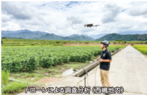
ドローンによる調査分析(西鳴地内)

有害鳥獣対策事業経費・あけぼの大豆関連経費・農地利用状況ドローン調査分析業務・6次産業化事業による枝豆共選所運營業務、矢細工試験圃場業務の委託料など