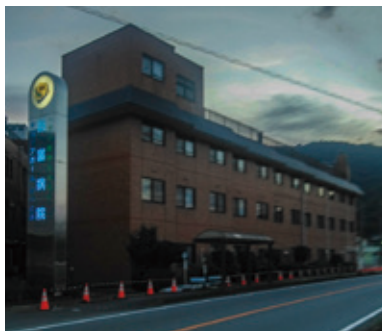
灯りの消えた老健施設

財政課長 峡南ケアホーム（いいとみ）は一部事務組合の施設であり、町の施設と横並びに考えることはできないが、町としてはどちらも重要な施設と考える。