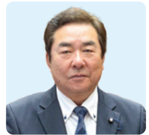
さの のぼる 議員 佐野 昇