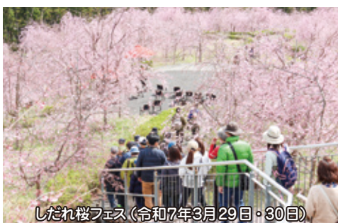
しだれ桜フェス(令和7年3月29日・30日)