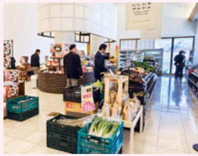
議会広報編集委員会で視察しました！