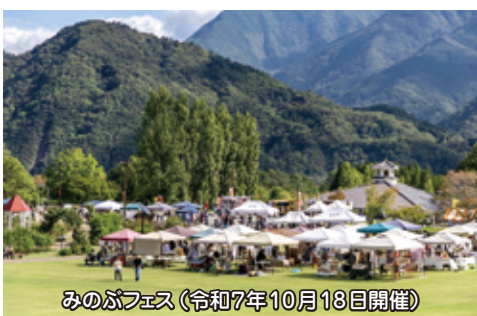
みのぶフェス(令和7年10月13日開催)

下部観光協会並びに身延山観光協会、みのぶフェス補助金・地域活性化イベント補助・観光資源の魅力アップ事業(しだれ桜の里・観光案内所・にしじま和紙の里管理費など)