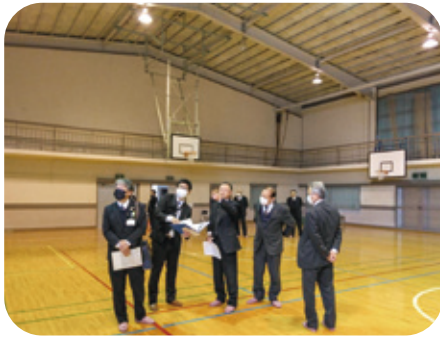
大河内体育館の中での説明