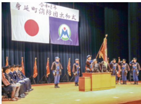
身延町消防団の出初式

問 峡南地域で身延町は他の4町すべてと接している。峡南地域5町の消防団員報酬と出動手当の現状は。 交通防災課長 団員報酬は年額、市川三郷町1万7千円、富士川町2万円、南部町と早川町が3万6千5百円、身延町は1万5千円である。出動手当は一日、市川三郷町4千円、富士川町6千円、南部町と早川町が8千円、身延町は4千円で、身延町が一番低い。ただし消防団にかかる経費は身延町が最高額となっている。