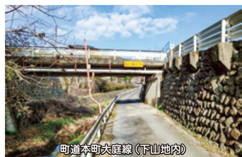
町道本町大庭線(下山地内)

町道桜清水遊亀橋線外道路改良工事、町道本町大庭線外1路線道路改良工事・町道本町大庭線用地取得費・温泉橋橋梁修繕工事・町道昭和道路線、町道西谷線ガードレール修景工事・町営住宅各団地維持管理費など