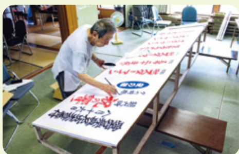
花火大会の看板製作

少子高齢化により転換期を迎えていますが、8月16日のお盆最後の夜を、家族や地域住民とともに過ごし、先祖や故人をしのぶ花火大会として、できるだけ長く続けていきたいと考えています。