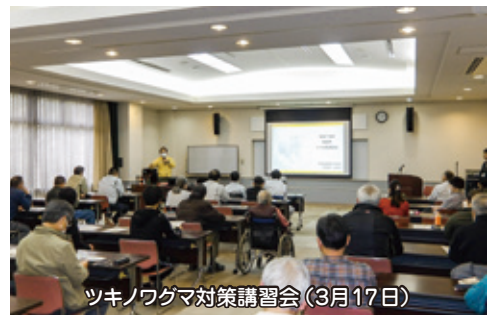
ツキノワグマ対策講習会(3月17日)