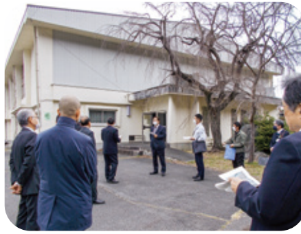
大河内体育館の外での説明

調査日 3月2日(月) 現地調査 場所 大河内体育館 目的 宅地分譲事業により解体予定の体育館を視察