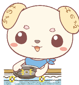
砂金採り体験「金山博物館」