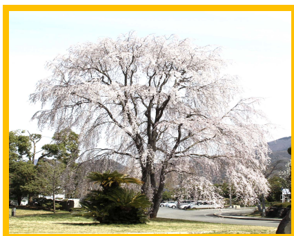
町の木 シダレザクラ